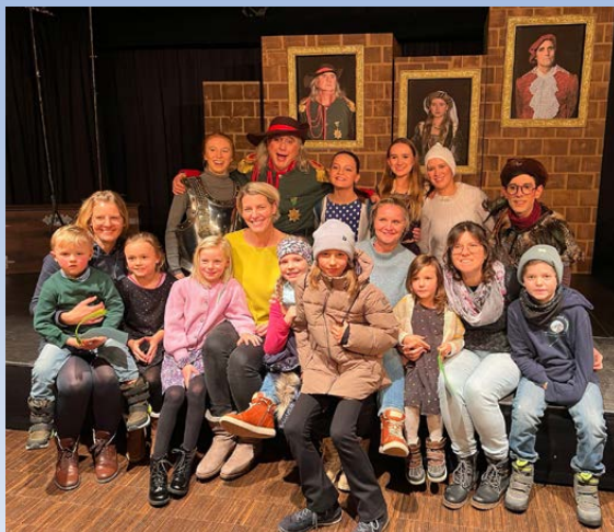
Das Ensemble des Freien Landestheaters Bayern zusammen mit den Familien aus dem KV Miesbach.