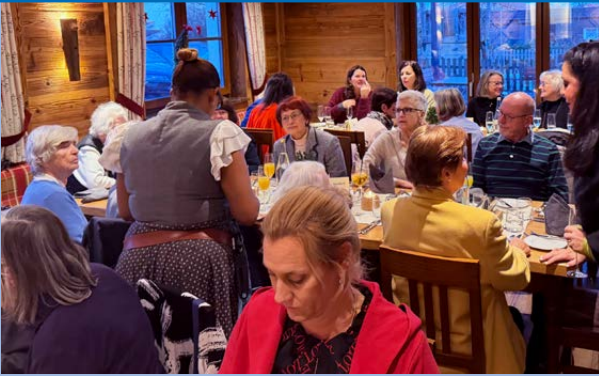
Die Mitglieder aus dem KV Starnberg tauschten sich beim gemeinsamen Essen rege aus.