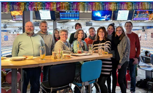
Die Teilnehmenden aus dem Kreisverband Bad Aibling-Wasserburg genossen den entspannten Abend auf der Bowlingbahn.

Alle beteiligten Mitglieder waren dabei und bereit, eine ruhige Kugel zu schieben. Ohne Ehrgeiz, dafür mit umso mehr Gelassenheit, stand der gemeinsame Moment im Mittelpunkt.