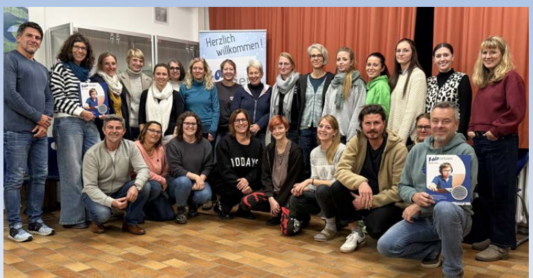
Teilnehmende des Seminars „fairnetzen“ mit den Kursleitern.