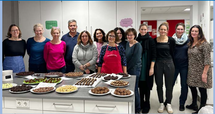
Die Teilnehmenden aus dem KV Traunstein können stolz auf ihre leckeren Ergebnisse sein.

Mit Blick auf die Zukunft freuen wir uns auf viele weitere gemeinsame BLLV-Momente.