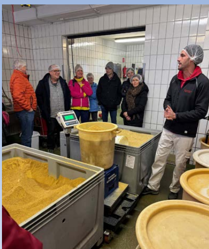
Die Mitglieder des Kreisverbands Altötting konnten live miterleben, wie aus einzelnen Zutaten Baumann's Senf entstand.