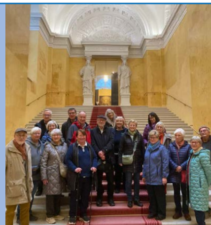
Die Pensionistinnen und Pensionisten aus Bad Tölz sieht man hier auf der Prunktreppe in der Residenz.