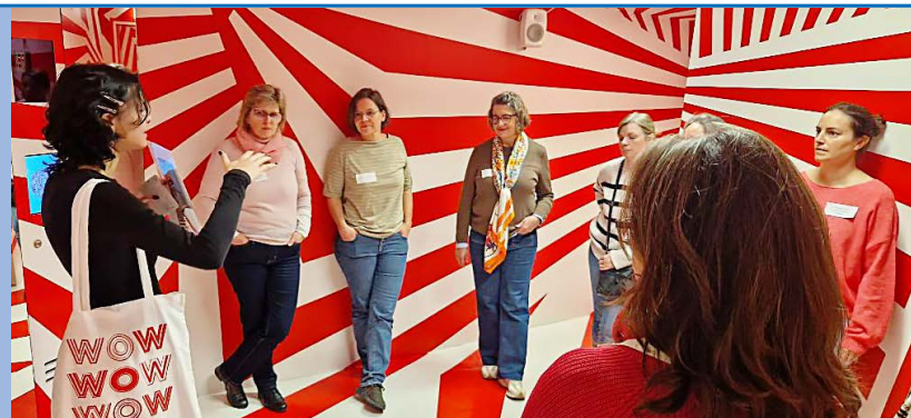
Die Verwaltungsangestellten aus dem Landkreis München hatten viel Spaß im WOW Museum.